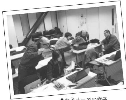
▲セミナーでの様子

月1回のセミナー開催に加えて、この1月から月1回の座談会を設けることにしました。